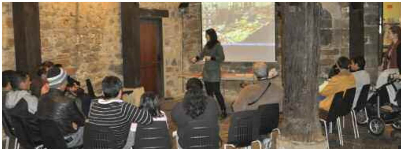
Migrazio teknikaria azalpenak ematen etorkinei otsailaren 18an egindako bileran.