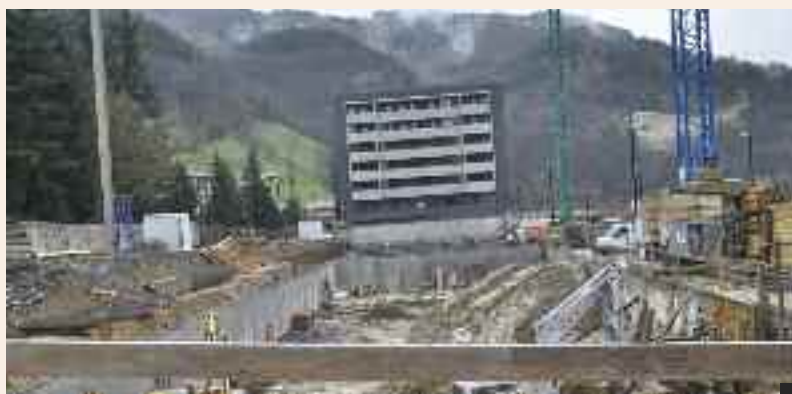
San Joango babes ofizialeko etxebizitza sail berria eraikitzen.

Se podrá obtener información sobre la promoción en las oficinas de la sociedad municipal Ordizia Lantzen, S.A. (Teléfono 943.212354. Avda de Zarautz n° 82- 3°. Donostia. e-mail: maider@esarbe.net