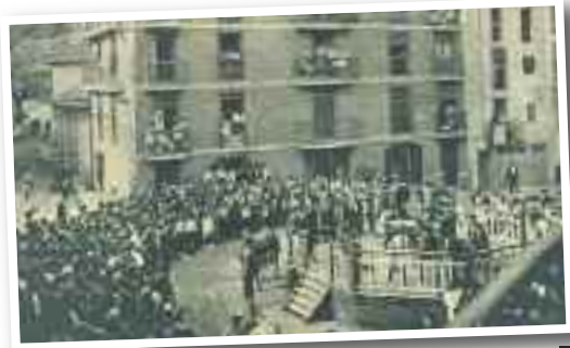
Euskal Jaietako Ganadu Lehiaketa Garagartza Plazan (1932)