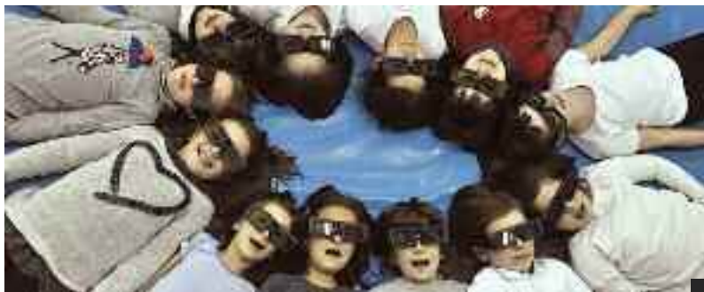
Ume talde bat betaurreko berriak jarrita pozik.