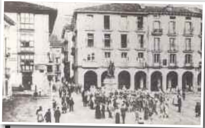
Plaza Nagusiaren irudi zaharra, egungo estalkia egin aurretik.