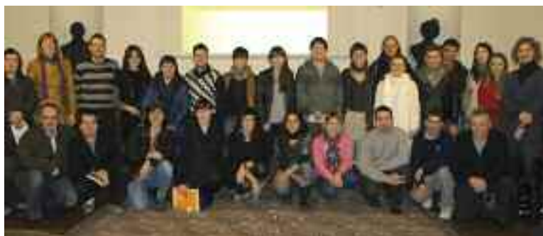
Euskadi 4000 programako langile berriak, sailtako arduradunekin.

El Ayuntamiento ha contratado a 16 trabajadores a través del Plan 4000, que ofrece el servicio Lanbide del Gobierno Vasco. Además de peones, se han contratado a trabajadores que participarán en proyectos sobre igualdad, prioridades de las personas mayores, euskera, comunicación, la Feria, bienestar social, cultura, medio ambiente y juventud. Así mismo, ha contratado por un año un agente municipal. Además, exigirá en las adjudicaciones de las obras de San Juan contratación de vecinos del municipio y abrirá la bolsa de trabajo municipal.